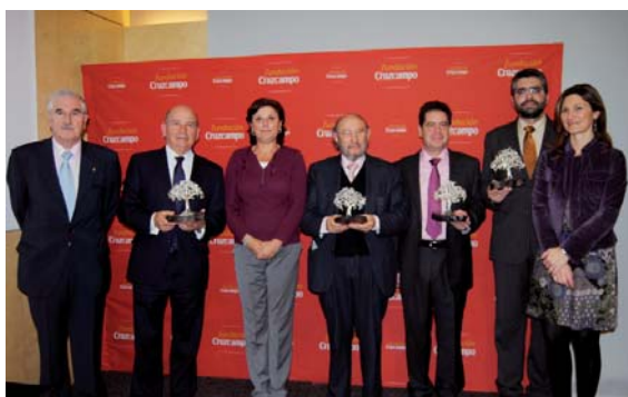
En la imagen, los premiados tras el acto de entrega en la Fundación

La Asociación de Peritos Judiciales y Tasadores de Andalucía entrega anualmente su premio Adriano para "reconocer a aquellas personas, físicas o jurídicas, que colaboran y contribuyen en el desarrollo y progreso de la Asociación".